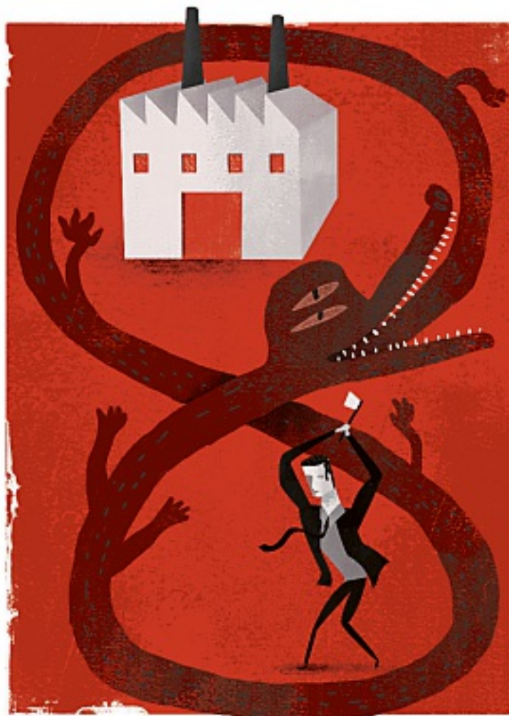
Luis San Vicente

Estos pasajes reflejan la realidad de un sistema sindical que, salvo pocas excepciones, no sirve a los trabajadores. Por el contrario, se les somete al líder, que se vale de su control para sacar dinero a los patrones y que